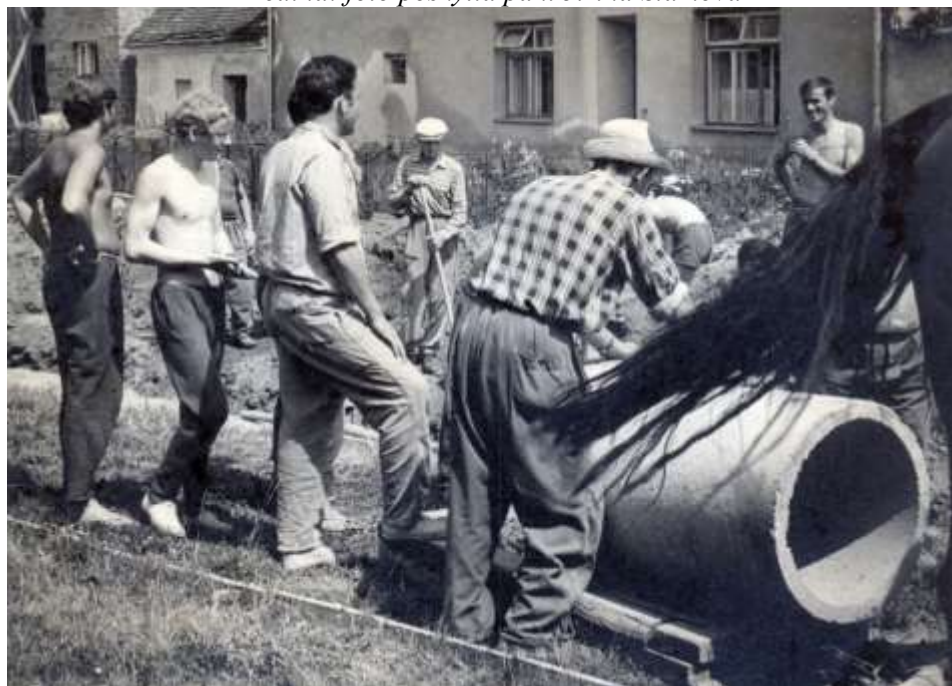
Kanalizace: foto poskytla paní Irena Sobotková