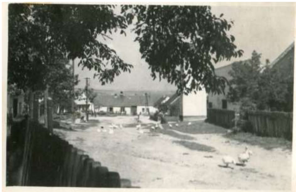
Dědina: foto pan Vlastimil Sláma