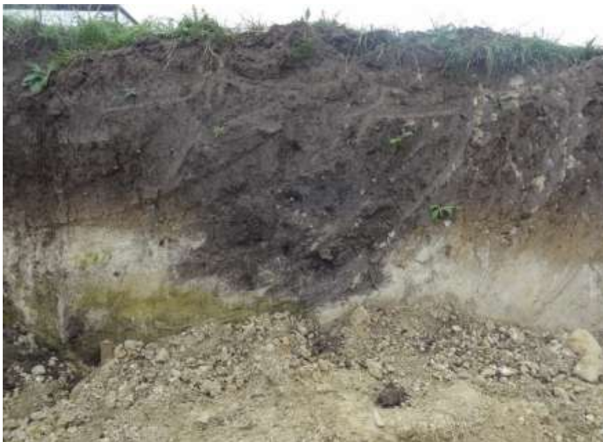
Lesonice - stavba domu J. Pavlů, nezačištěný profil (2013).