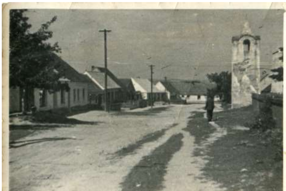
Dědina: foto pan Vlastimil Sláma