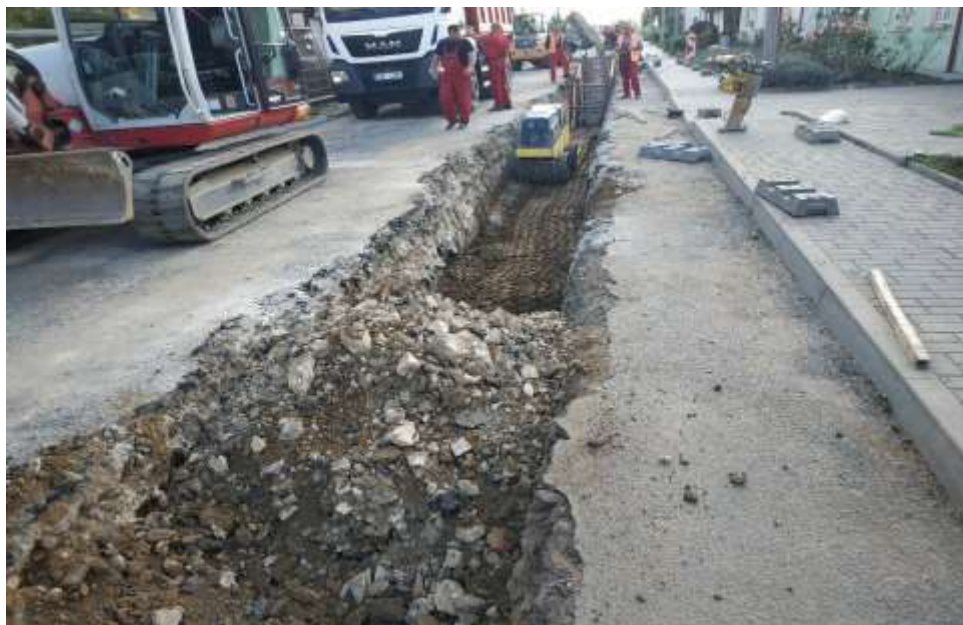
Stavební práce na kanalizaci – ulice směrem na Petrovice

V současné době zdražování a nejistoty dostupnosti materiálů všeho druhu je možno očekávat, že plánovaný rozpočet dozná změn. Ve spolupráci s hlavním investorem VAK Třebíč vše projednáváme a hledáme cesty jak stavbu udržet v rozmezí rozpočtu.