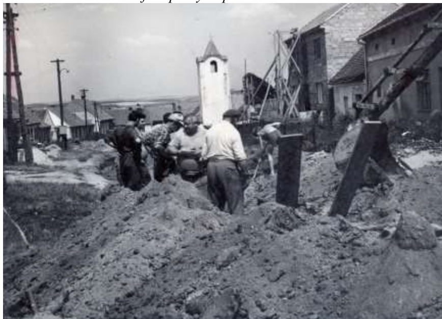
Dědina: foto poskytla paní Irena Sobotková