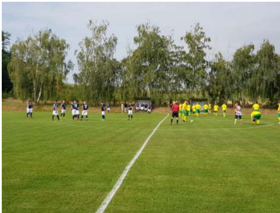
Zápas Lesonice – Petrovice na petrovickém hřišti