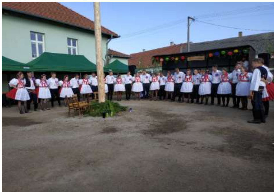
Lesonické hody 2021