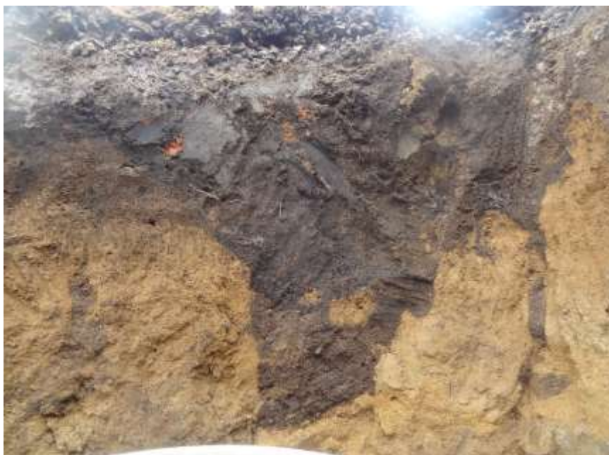
Petrovice - výkop kanalizace, profil začištěný archeologem (2015)