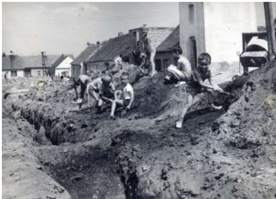
Dědina: foto poskytla paní Irena Sobotková