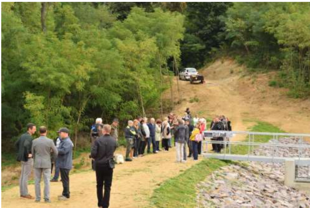
Otevření vodního díla Lesonice za přítomnosti veřejnosti