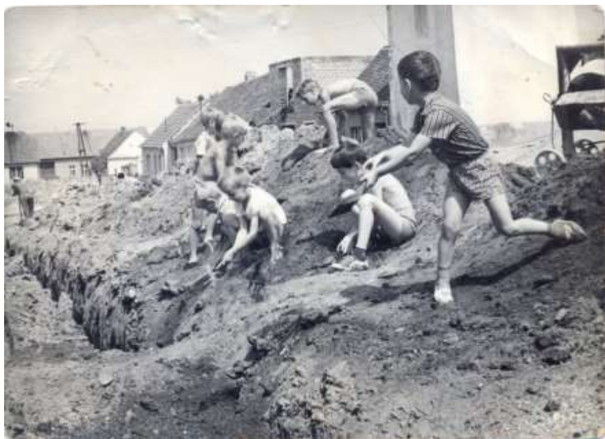
Dědina: foto poskytla paní Jiřina Slámová