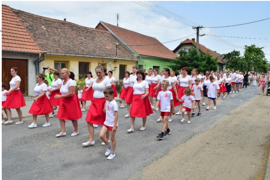
Ženy a děti ve slavnostním pochodu, Lesonice, 15.6.2019