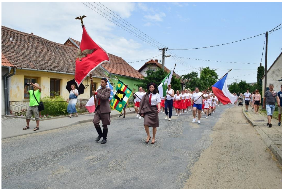
Čelo slavnostního pochodu, Lesonice, 15.6.2019

Poděkování patří nejenom všem členům Sokola z Lesonic, Petrovic a starostům těchto obcí, ale také všem občanům, kteří svou pomocí přispěli k důstojnému připomenutí tohoto významného výročí. Všem předcházely dlouhé několikaměsíční přípravy, nácviky jednotlivých vystoupení a zpracovávání programu. Prožili jsme v tom čase společně nádherné chvíle pospolitosti a nadšení. Dokázali jsme společně připravit náročnou, ale důstojnou ukázkou toho, že Sokol jde kupředu, že je spolkem 21. století.