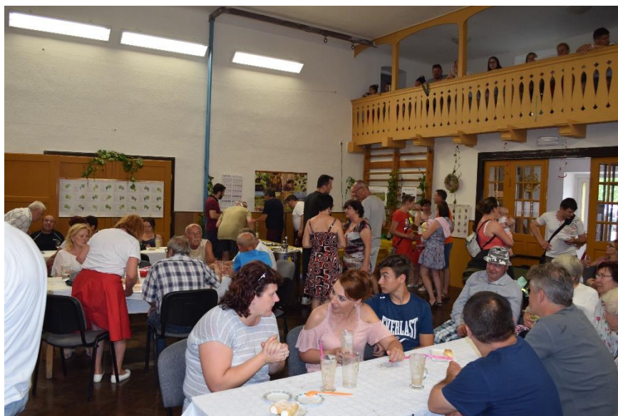
Večerní program v Sokolovně, Lesonice 15.6.2019