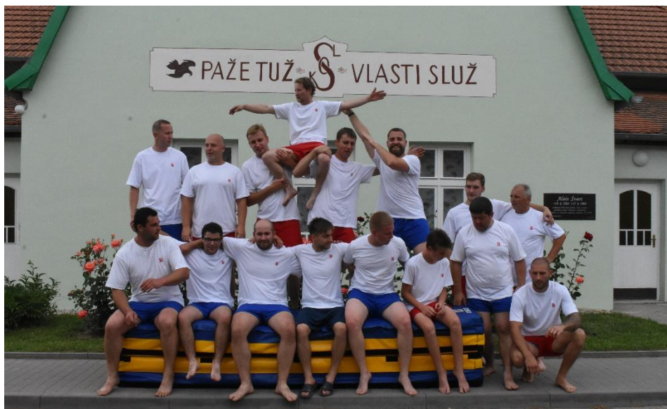
Cvičenci – muži, Lesonice, 15.6.2019