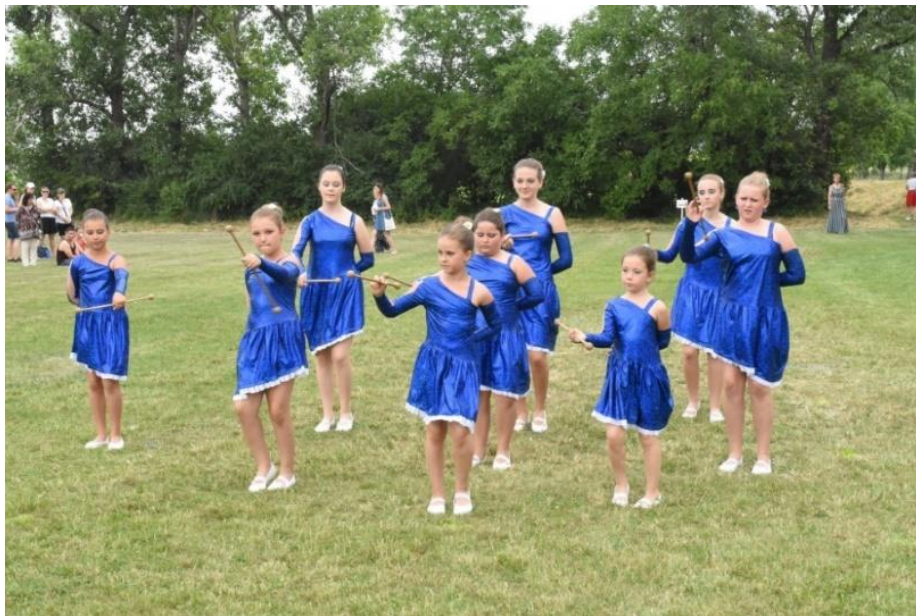
1. Ročník tenisového turnaje smíšených dvojic