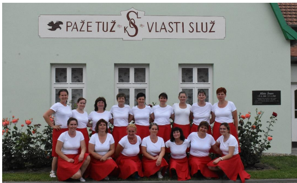
Cvičenci – ženy, Lesonice, 15.6.2019