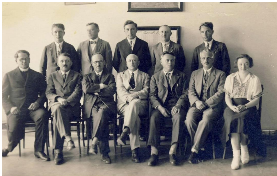
Učitelský sbor v Ivančicích - šk. rok 1931/32 - foto červen 1932