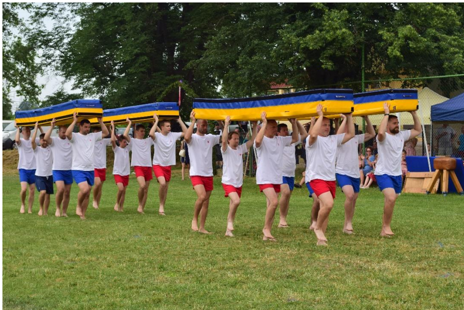
Sestava muži, Lesonice, 15.6.2019