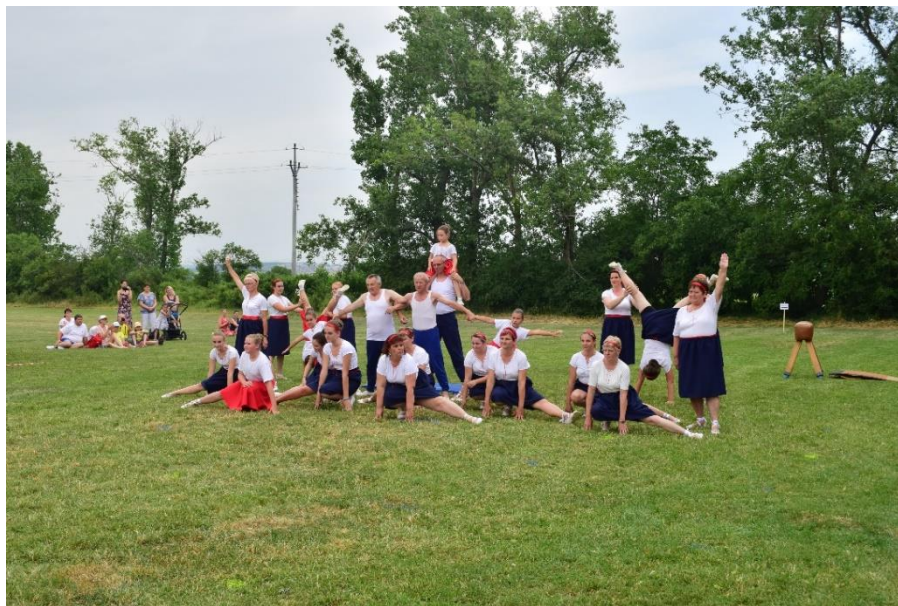
Sestava z otevření petrovické doškové chaloupky , Lesonice, 15.6.2019