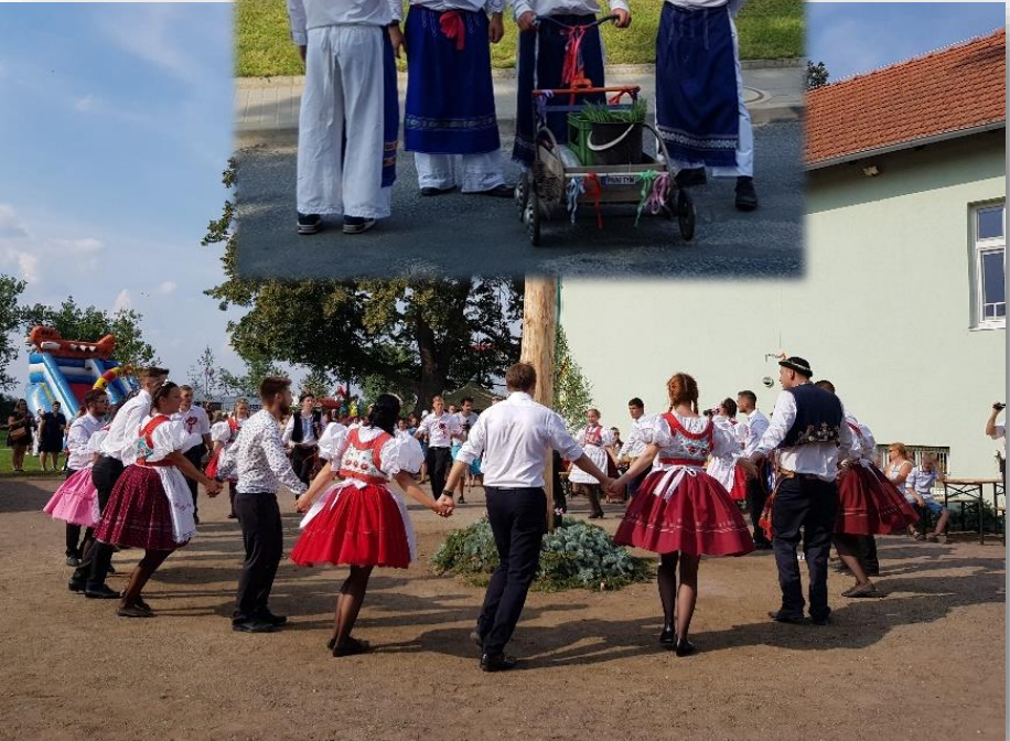
Lesonické hody 2019 v obrazech