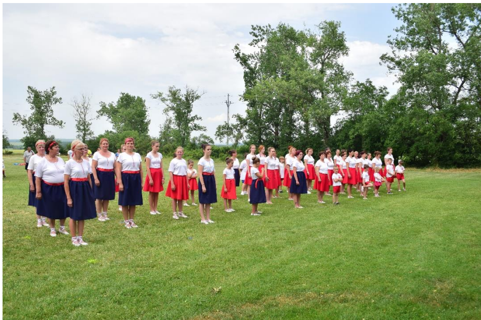
Petrovické a lesonické ženy s dětmi při nástupu, Lesonice, 15.6.2019