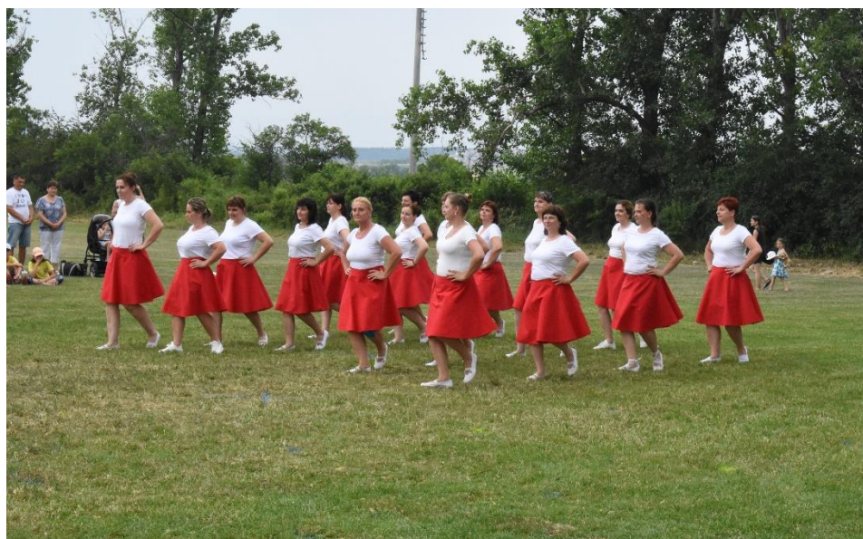
Sestava ženy, Lesonice, 15.6.2019