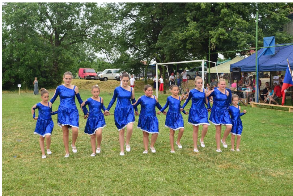
Vystoupení mažoretek, Lesonice, 15.6.2019