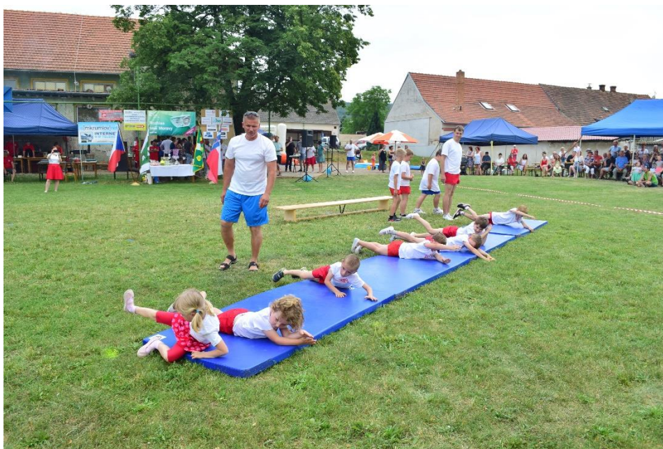
Sestava nejmenší děti, Lesonice, 15.6.2019