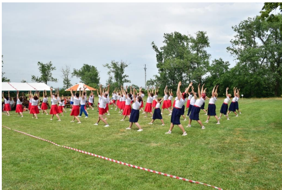
Smíšená sestava cvičenců z Lesonic a Petrovic, Lesonice, 15.6.2019