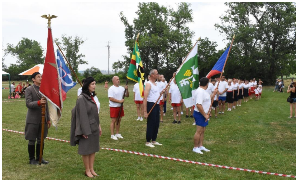
Slavnostní nástup na hřišti za Sokolovnou, Lesonice, 15.6.2019