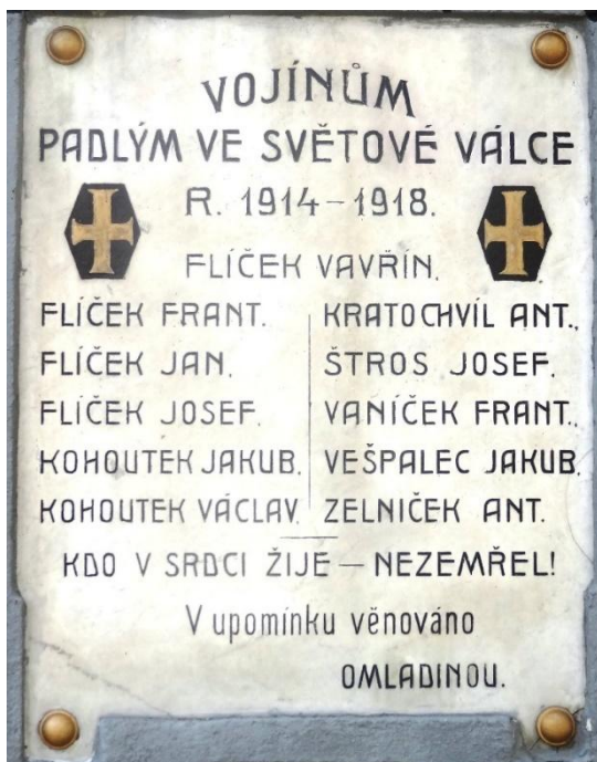
Detail nápisu na pomníku