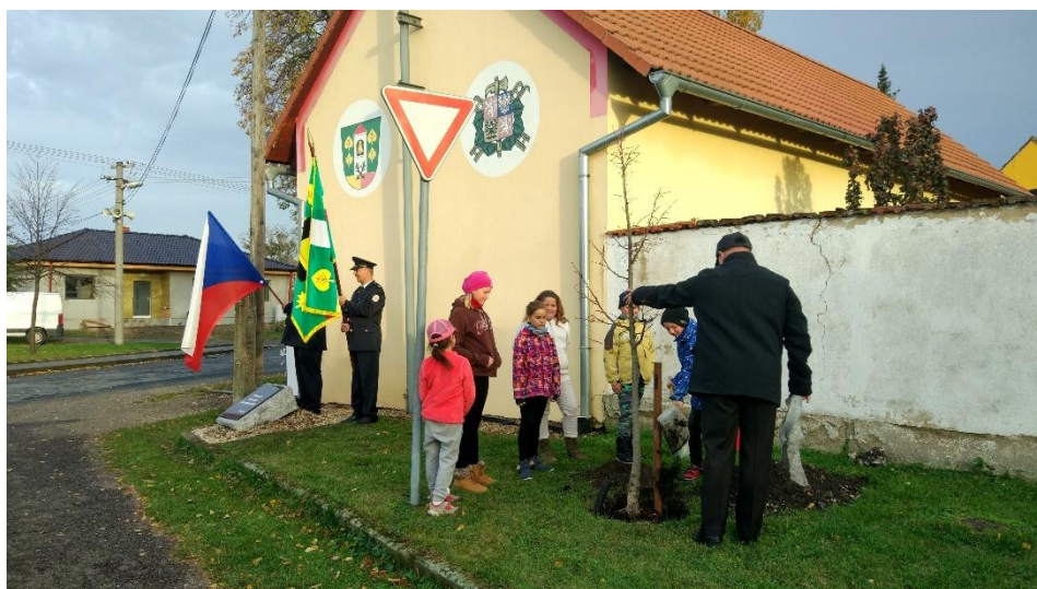
výsadbá lípové aleje na počest založení Československa