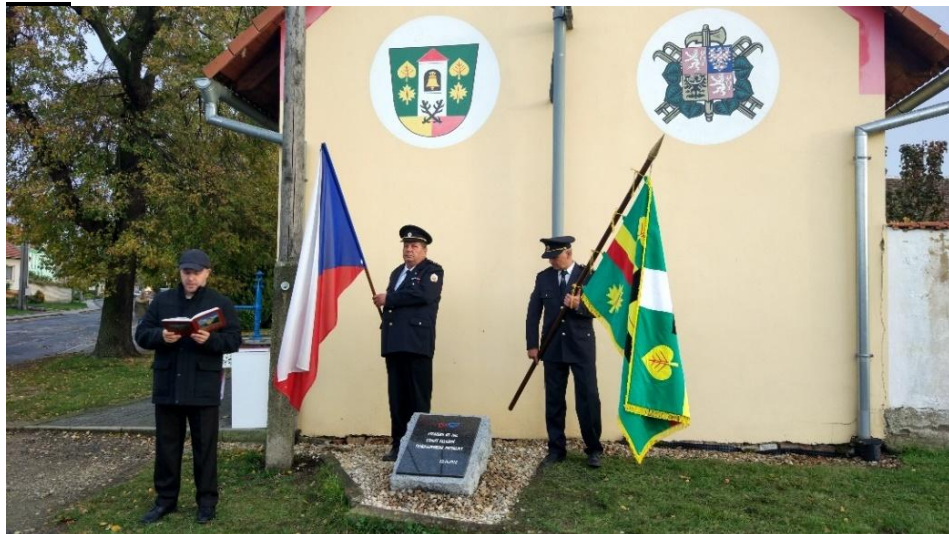
čestná stráž u pamětní desky