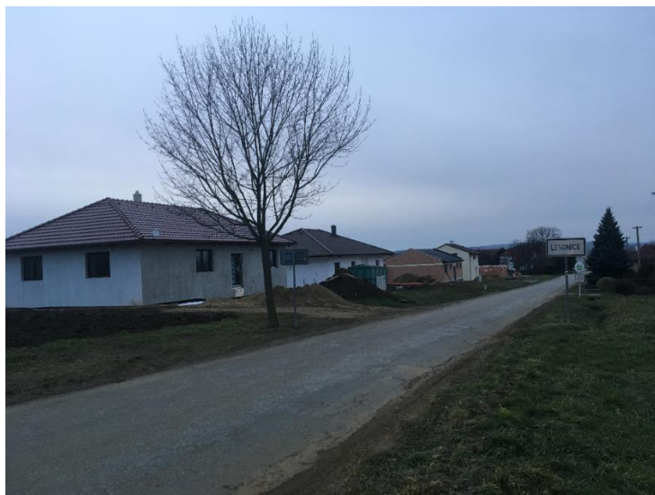
Zástavba RD v ulici směrem na Mir. Knínice významně pokročila