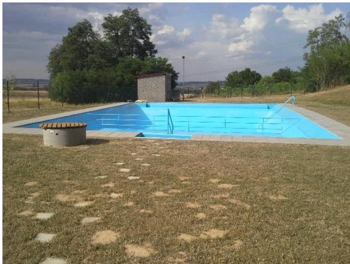
Rekonstrukce koupaliště - v roce 2017 zprovozněna čistička vody, oplocení, první sezóna s novým povrchem zahájena – luxusní koupání zajištěno!