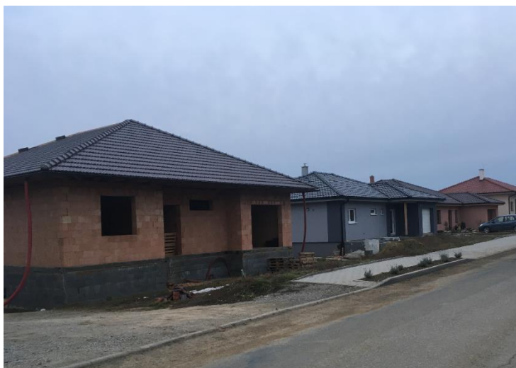
Plánovaná zástavba RD v části Mexiko se meziročně rozrostla o další RD