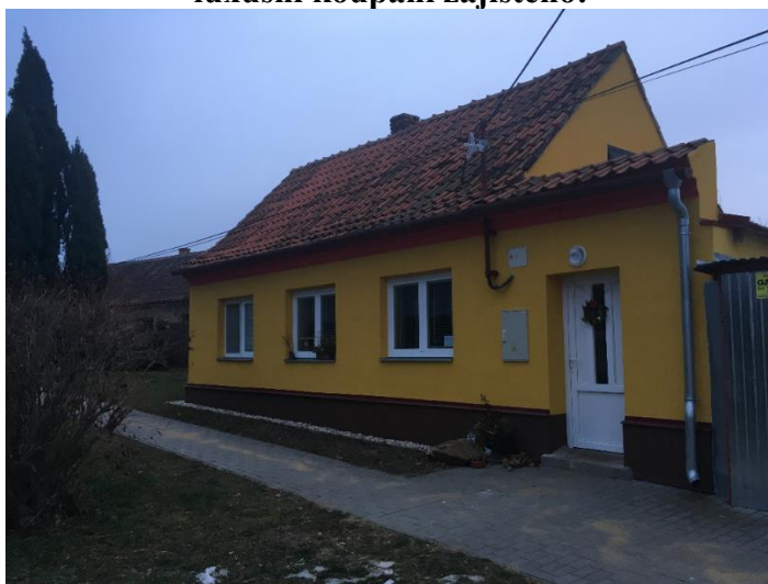
Rekonstrukce chátrající a jinak nevyužité „klubovny“ pro smysluplné využití jak obcí, tak místní školou.