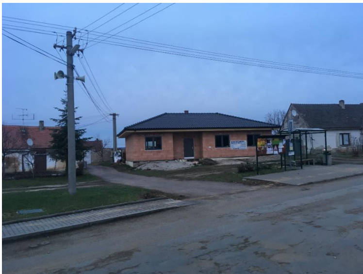
Zdařilá výstavba RD v centru obce u zastávek