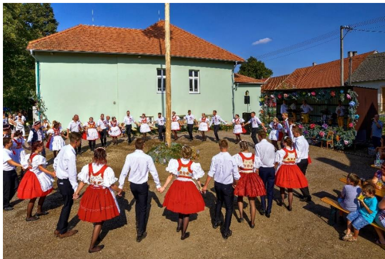
Lesonické hody 2017