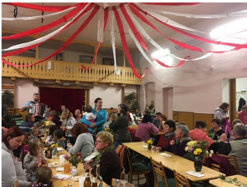
Lesonická ochutnávka pomazánek - letos rozšířena o vzorky místních vinařů