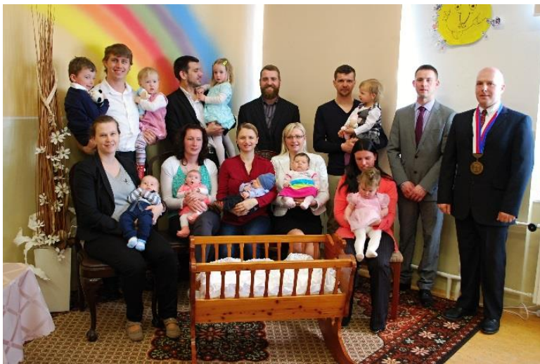
Vítání občánků Lesonic 2017