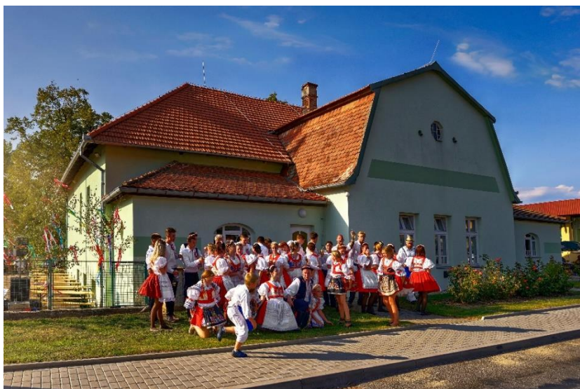
Lesonické hody 2017