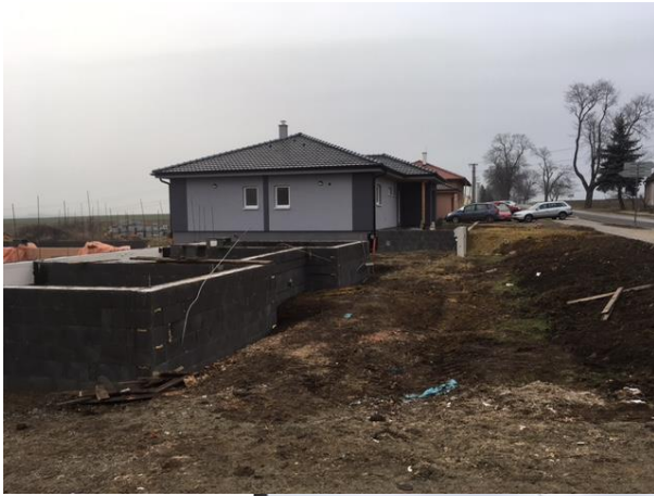
Výstavba RD ve směru na Moravský Krumlov