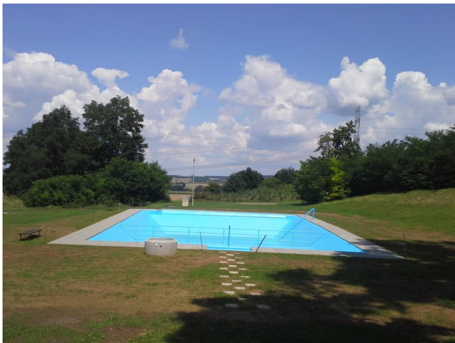
První etapa rekonstrukce koupaliště v Lesonicích 2016