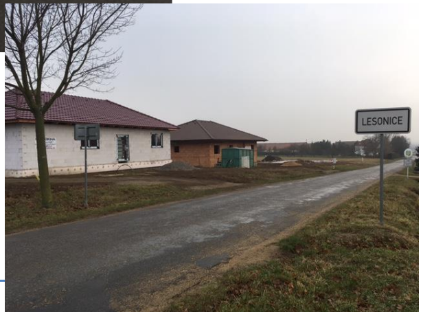
Výstavba RD ve směru na Miroslavské Knínice