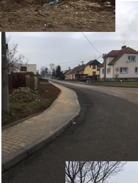
Další etapa opravy chodníků v obci