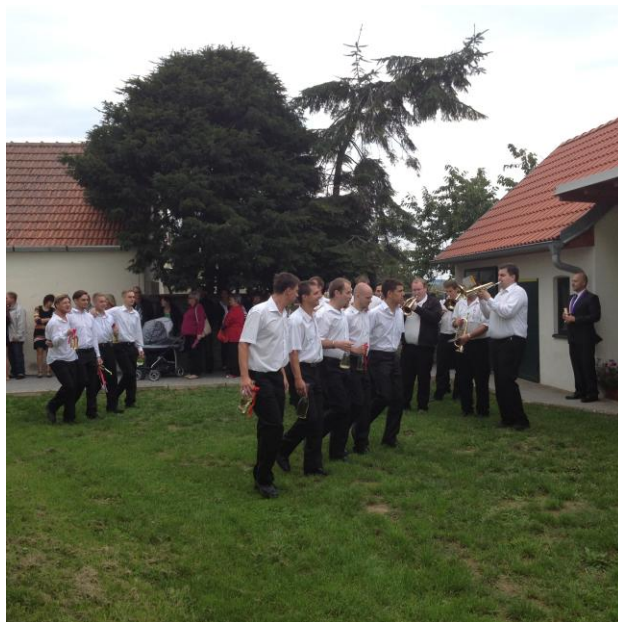
30.srpen 2014: Hode bele,hode bodó....